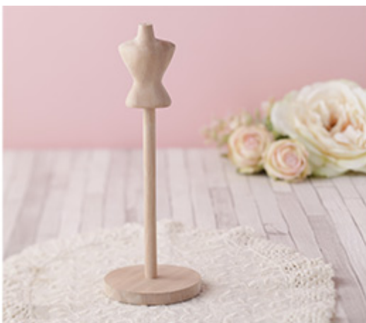
【22023】 オリジナル ミニトルソー&スタンド s e t