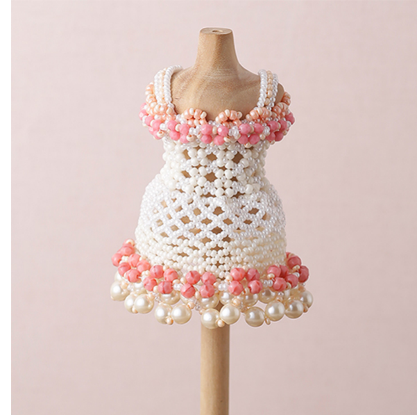
【12637】 パラレルステッチのフリルドレス～Jolie～ピンク ＊レシピなし