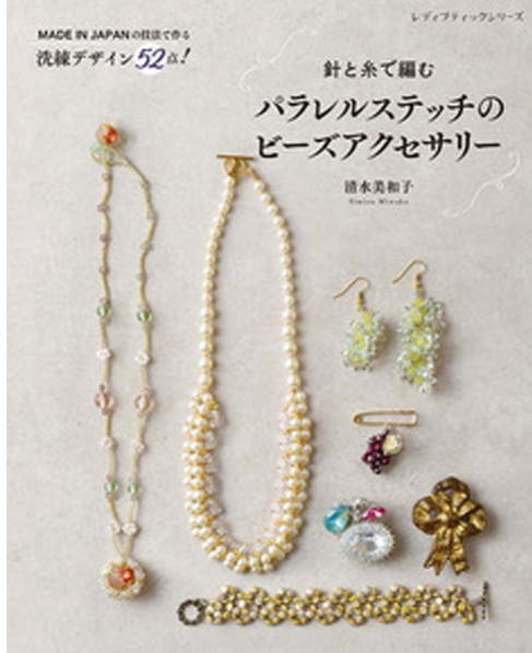
【13516】 針と糸で編む パラレルステッチのビーズアクセサリー (ブティック社)