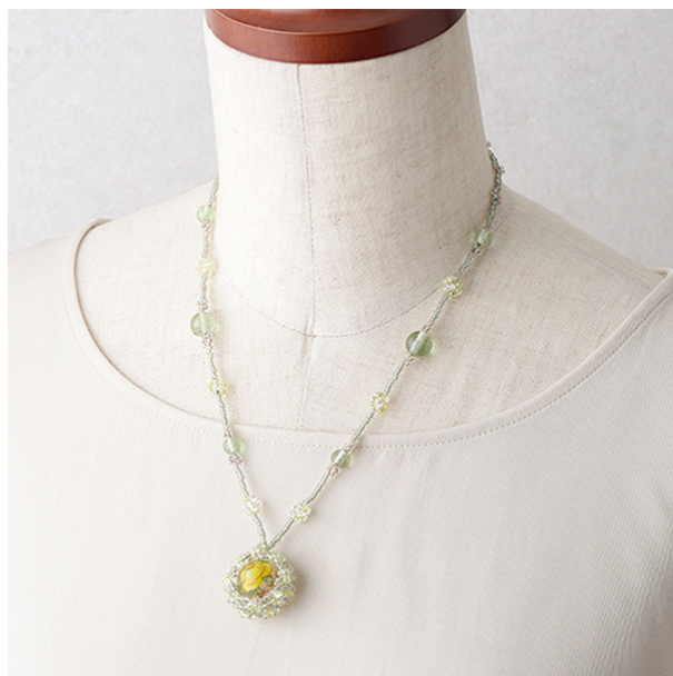
【12636】 パラレルステッチフレーミングのネックレス～ジェイドローズ～ ※レシピなし