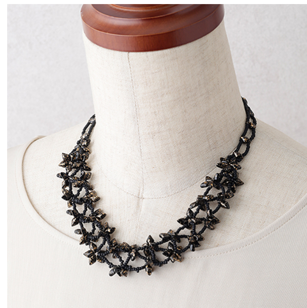
【12635】 マルチホール（ダイヤ形）のネックレス～ステラフィリーチェ～ ※レシピなし