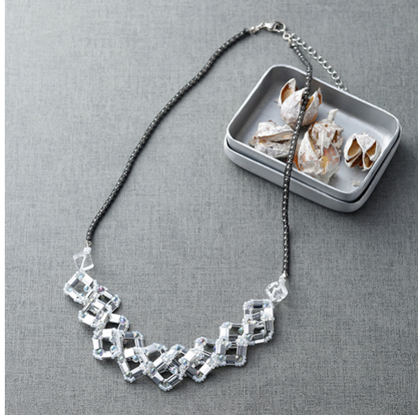
【12634】 パラレルステッチのネックレス～スクウェアドロップ～