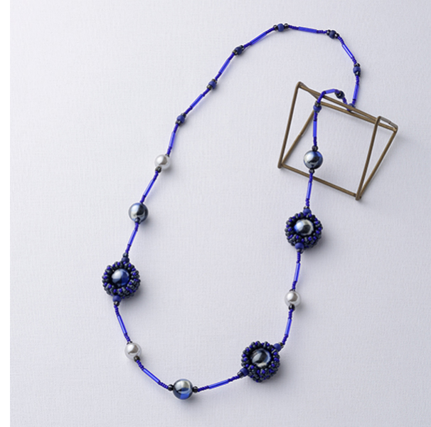
【12633】 パラレルフレーミングモチーフのロングネックレス～タルタン～